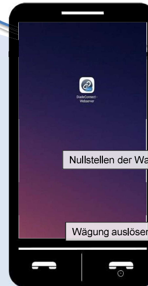
Symbol auf dem Startlayout

Damit der Webserver auf der Diade funktioniert, muss zwingend eine große Datenbank auf dem Wägeterminal installiert sein.